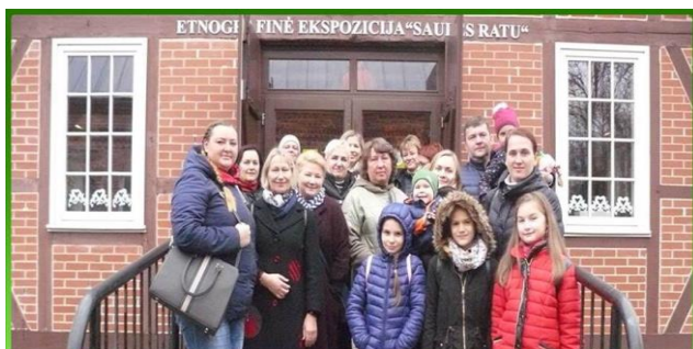
11.17 DUONOS KEPIMO EDUKACIJA KRETINGOJE

Sėkmingai įgyvendintas projektas "Puoselėjime lietuviškas kultūros tradicijas" 2018 m. (finansuojamas Socialinės apsaugos ir darbo ministerijos pagal nevyriausybinių organizacijų ir bendruomeninės veiklos stiprinimo veiksmų plano priemones "Remti bendruomeninę veiklą savivaldybėse"). Vyko lietuvių liaudies žaidimų, šokių ir dainų edukacijos – vakaronės, duonos kepimo, saldinių gaminimo edukacijos, advento vainiko pynimo, kalėdinės eglutės konstravimo bei nėrimo kūrybinės dirbtuvės, kalėdinių žaisliukų gaminimo edukacija bei Paupių eglutės įžiebimo šventė