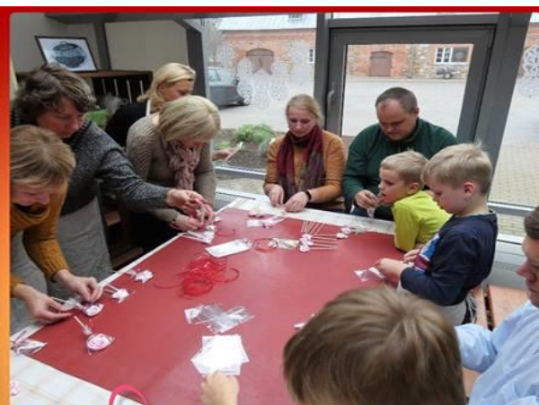
11.10 SALDAINIŲ GAMINIMO EDUKACIJA KRETINGOJE