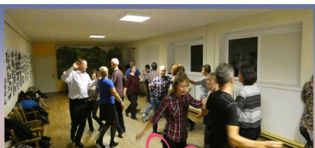
10.27 Su šokiais, dainomis ir žaidimais prasidėjo šių metų Asociacijos Paupių bendruomenės projekto "Puoselėjime lietuviškas kultūros tradicijas" Edukacija