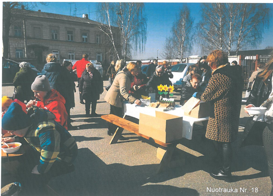
Nuotrauka Nr. 18