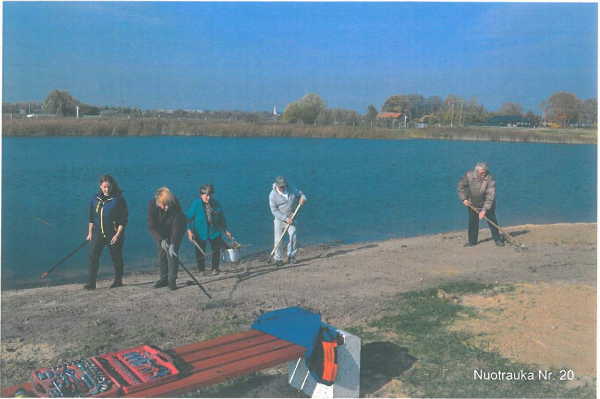
Nuotrauka Nr. 20