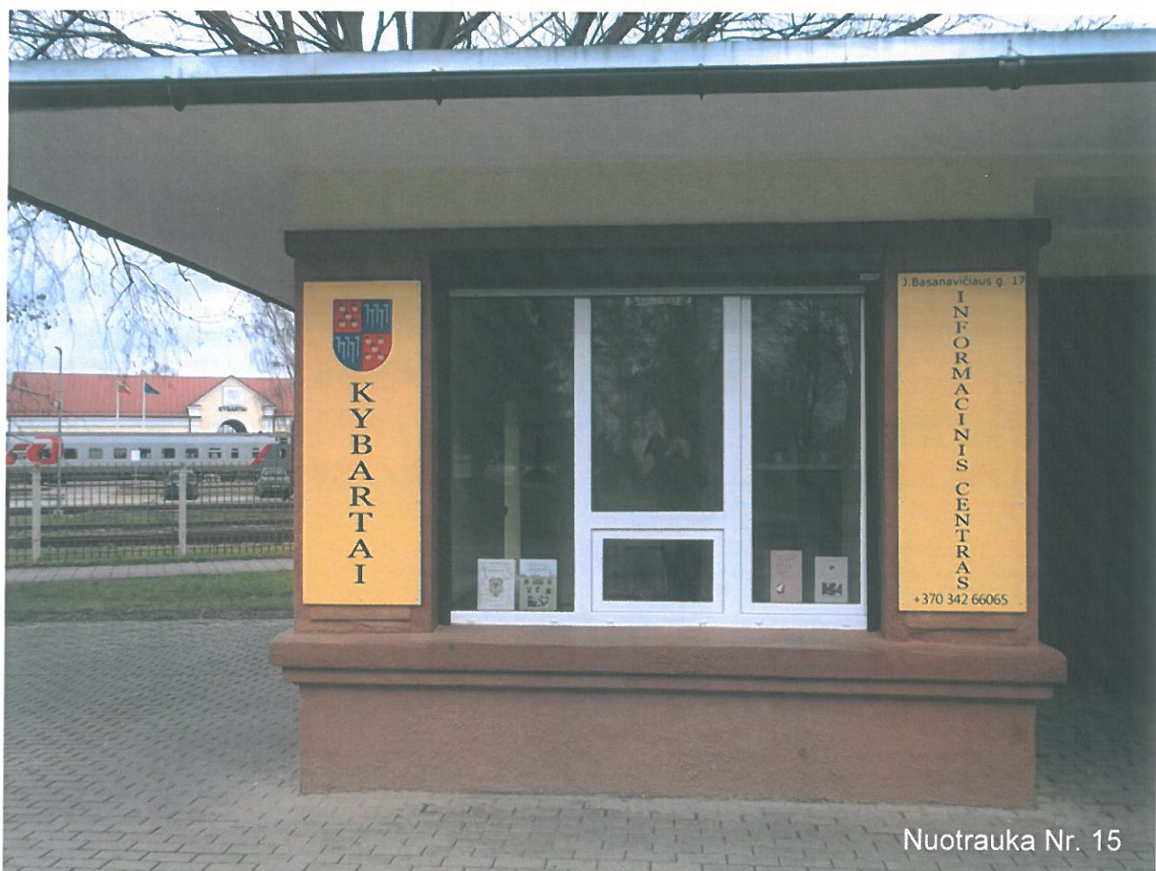
Nuotrauka Nr. 15