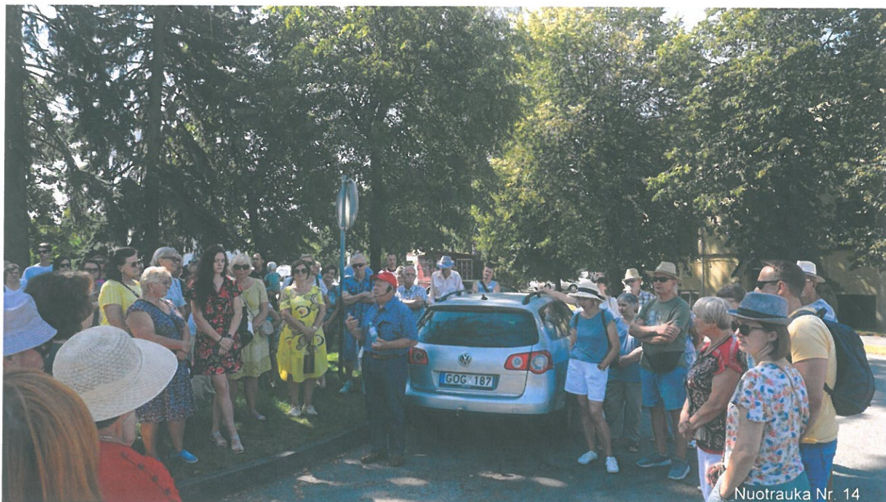
Nuotrauka Nr. 14