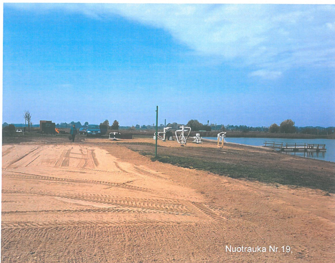
Nuotrauka Nr. 19;