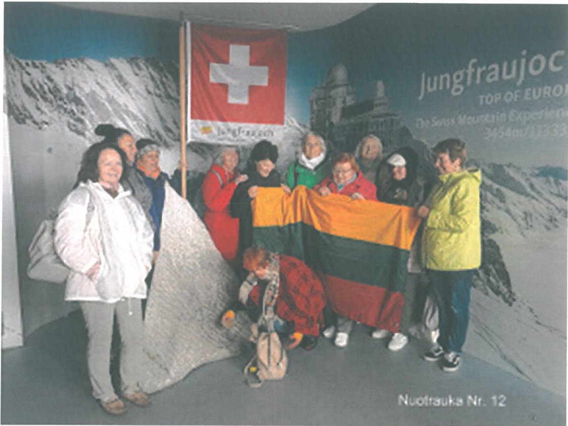
Nuotrauka Nr. 12