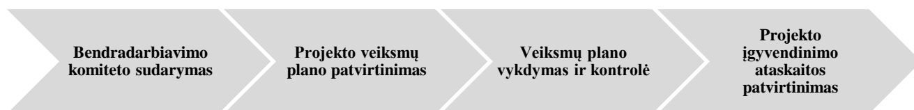
2 pav. Preliminarus teorinio vietos bendruomenės ir savivaldos institucijų bendradarbiavimo būsto politikos klausimais modelio schema

Preliminarus teorinio vietos bendruomenės ir savivaldos institucijų bendradarbiavimo būsto politikos klausimais modelio schema pateikta 2 paveiksle.